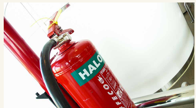
HALOTRON Feuerlöscher am Flughafen Doha (Katar).