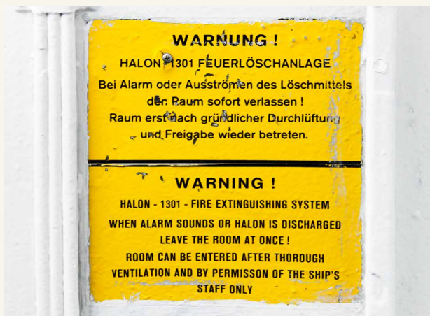
Warnschild an Bord eines Schiffes

Da Halone in hohem Maß die Ozonschicht angreifen, sind Feuerlöscheinrichtungen auf Halonbasis in den meisten Staaten verboten bzw. dürfen nur noch dort eingesetzt werden, wo sie nicht durch andere Löschmittel ersetzt werden können (etwa in Flugzeugen). Noch bestehende Löschanlagen bzw. Handlöscher dürfen nach Gebrauch nicht mehr aufgefüllt werden, sondern müssen durch alternative Löscheinrichtungen ersetzt werden.