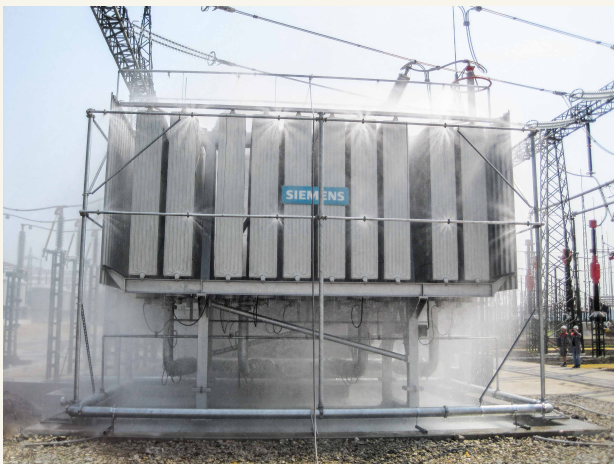
Sprühflutkäf für einen Transformator des Umspannwerks Bisamberg