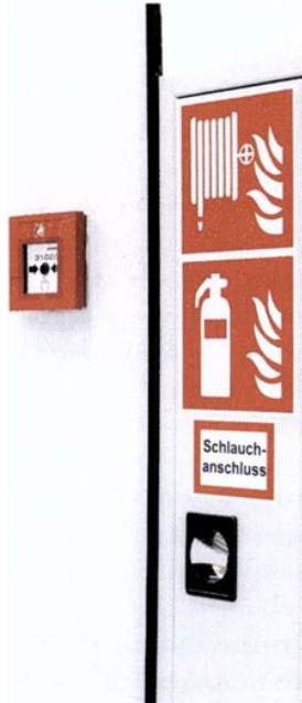
Erste und erweiterte Löschhilfe: Handauslösetaster zur Alarmierung der Feuerwehr