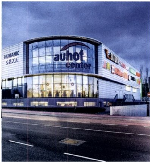
Das Auhof Center ist Wiens zweitgrößtes Einkaufszentrum